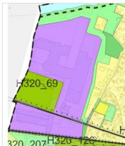
Illustrasjon nr. 1: Utsnitt kommuneplan